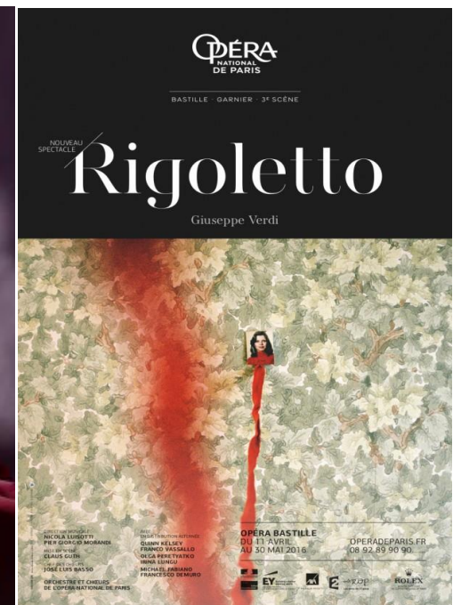
Arcades mardi 26 avril à 19h30

N° 243 avril 2016 27 ème année Association loi 1901 n°08760 x89 www.cinecroisette.com