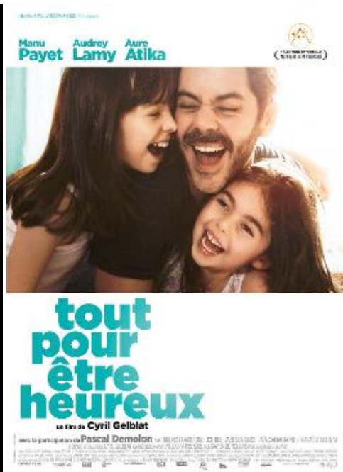
Olympia mercredi 13 avril 20h05