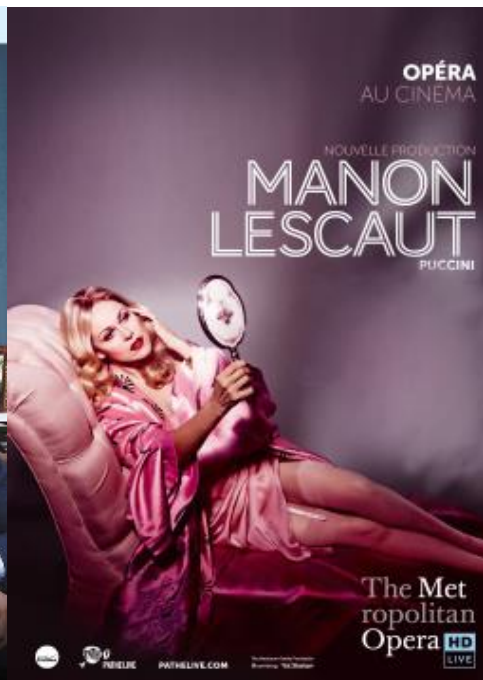
Olympia Samedi 23 avril 19h