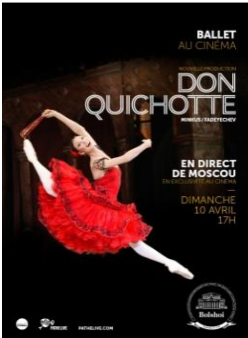
Olympia ballet dimanche 10 avril 17h