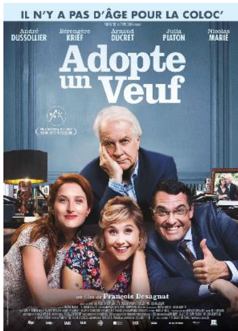
Olympia Mercredi 20 avril 20h05