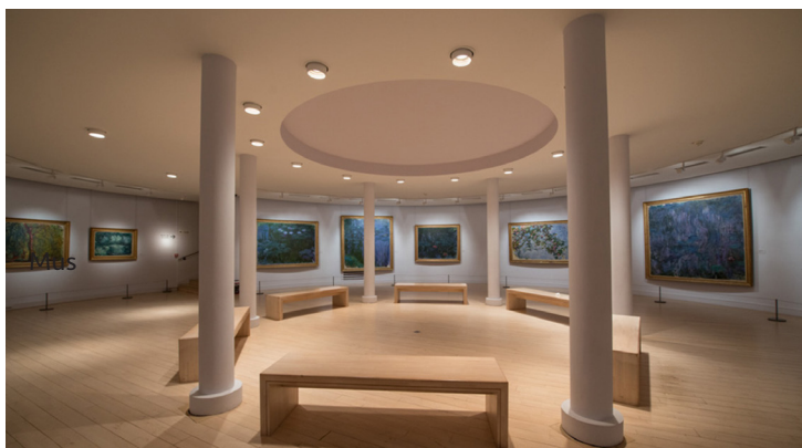
Musée Marmottan, Paris

Musée Marmottan, Paris - www.marmottan.fr